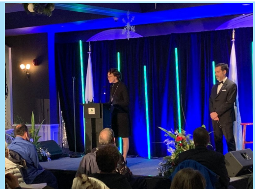
Le souper des bénévoles de la ville de Bois-des-Filion a été une belle occasion de souligner l'apport inestimable de ces personnes à leur communauté.