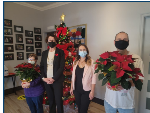
En 2021, j'ai eu le privilège d'être la présidente d'honneur de la campagne de financement de l'Atelier Altitude «Apporter de la joie, un poinsettia à la fois».