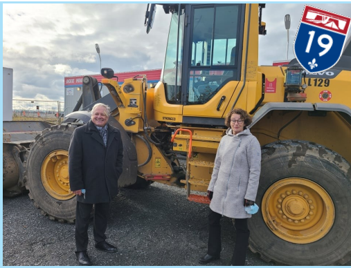
En compagnie de mon collègue Luc Desilets, député de Rivière-des-Mille-Îles, lors de la première pelle-tée de terre du prolongement de l'A-19.