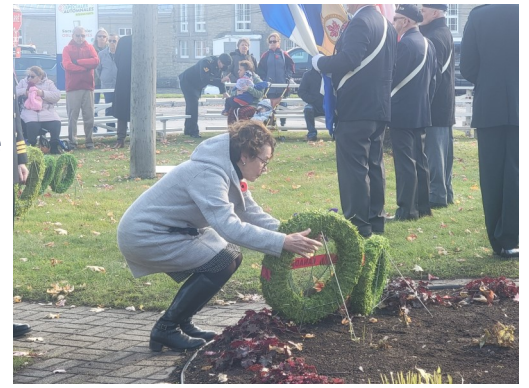
Le 6 novembre dernier, j'ai déposé une couronne à la Place du Souvenir de Sainte-Thérèse dans le cadre du Jour du Souvenir.