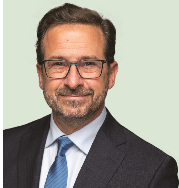
Yves-François Blanchet Député de Beloeil-Chambly et chef du Bloc Québécois

Le Bloc Québécois souhaite préserver le poids du Québec dans les institutions canadiennes, jusqu'à ce que la question de notre avenir national soit de nouveau posée. Il souhaite toutefois faire plus et mieux : conférer un sens au vote de la Chambre des communes que nous avons gagné à l'arraché le 16 juin 2021 : le Québec forme une nation dont la seule langue commune et la seule langue officielle est le français. Il ne nous faut pas moins de sièges au parlement d'Ottawa : il nous en faut plus.