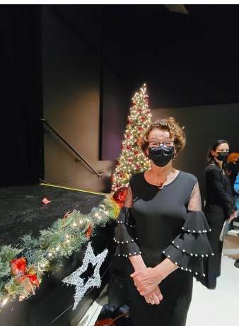
Le 11 décembre dernier, les Chanteurs de Lorraine nous ont offert une brillante prestation lors de leur concert où ils ont interprétés plusieurs grands classiques du temps des fêtes!