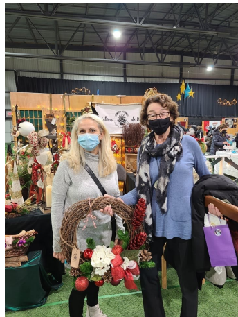
Le 27 novembre dernier, j'étais au salon des métiers d'art de Blainville où étaient présents une quarantaine d'exposants. J'ai profité de l'occasion pour faire l'achat d'une couronne de Noël, conçue par Créations Ana!