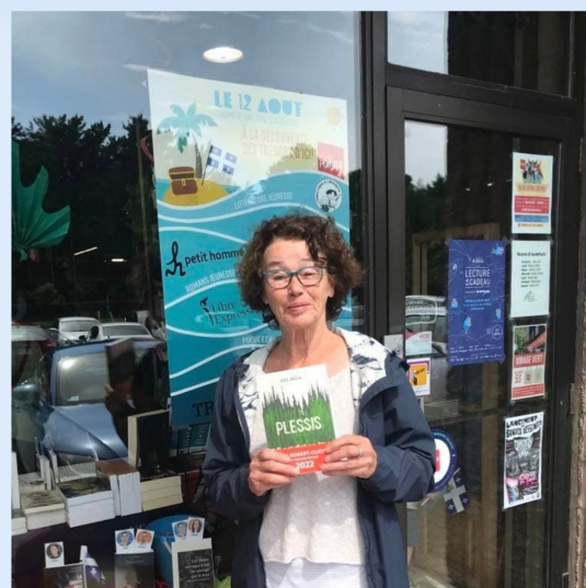
Le 12 août, j'achète un livre québécois ! J'en ai profité pour me procurer Plessis, du jeune et brillant auteur Joël Bégin.