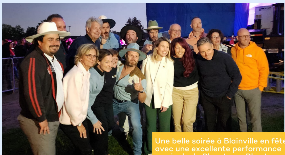
Une belle soirée à Blainville en fête avec une excellente performance musicale de Bleu Jeans Bleu !