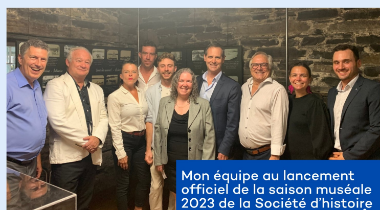
Mon équipe au lancement officiel de la saison muséale 2023 de la Société d'histoire et de généalogie des Mille-Îles.