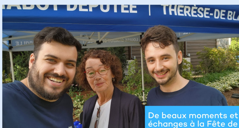
De beaux moments et échanges à la Fête de la famille de Lorraine !