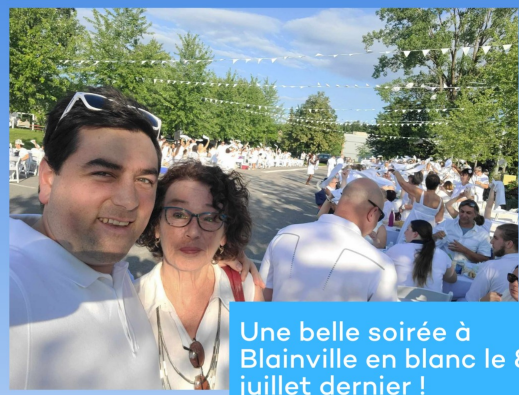
Une belle soirée à Blainville en blanc le 8 juillet dernier !