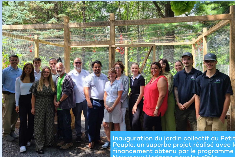
Inauguration du jardin collectif du Petit Peuple, un superbe projet réalisé avec le financement obtenu par le programme Nouveaux Horizons pour les aînés.