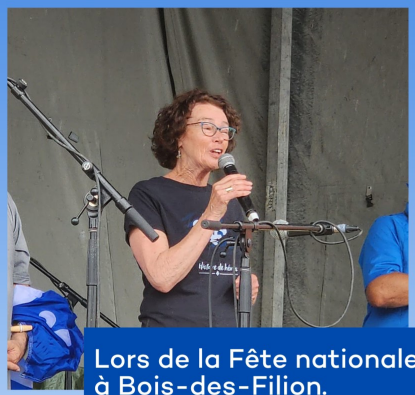
Lors de la Fête nationale à Bois-des-Filion.